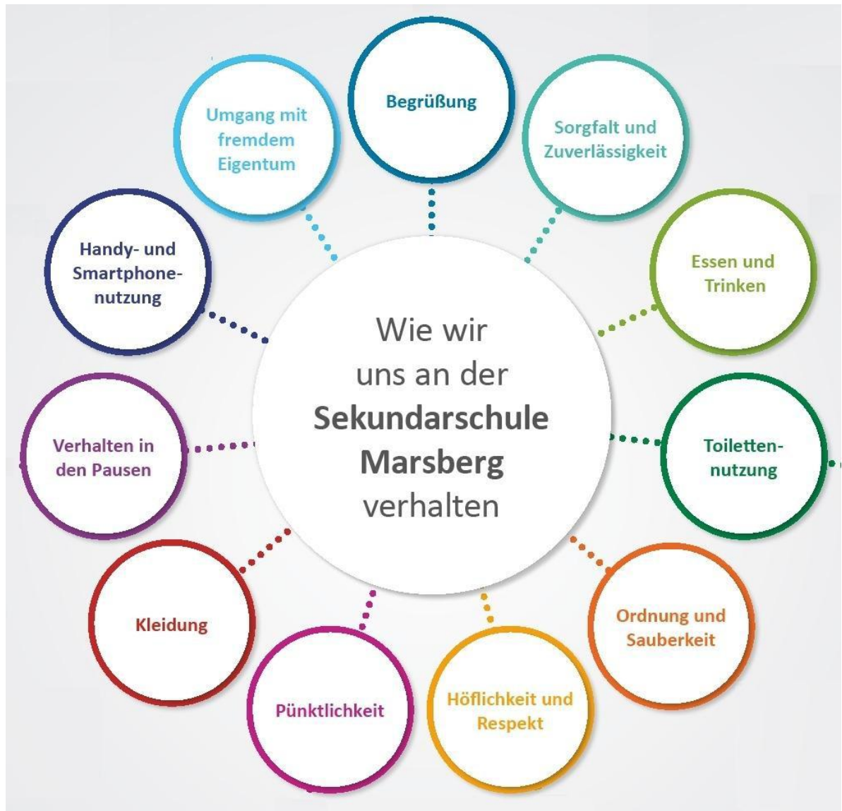
Abbildung 3: Die Bereiche des Wertekonzepts

Wir möchten an unserer Schule wertschätzend gemeinsam leben und Lernen. Anbei sind alle gefordert, Verantwortung zu übernehmen. Eindeutige Regeln und Konsequenzen bei Verstößen sorgen für Orientierung. Nur konsequentes Handeln nach festgelegten Verfahrensweisen sowie gemeinsamen und gültigen Standards geben allen Beteiligten Sicherheit und schaffen eine Basis für ein friedliches und respektvolles Miteinander, was ein Qualitätsmerkmal unserer Schule sein soll.