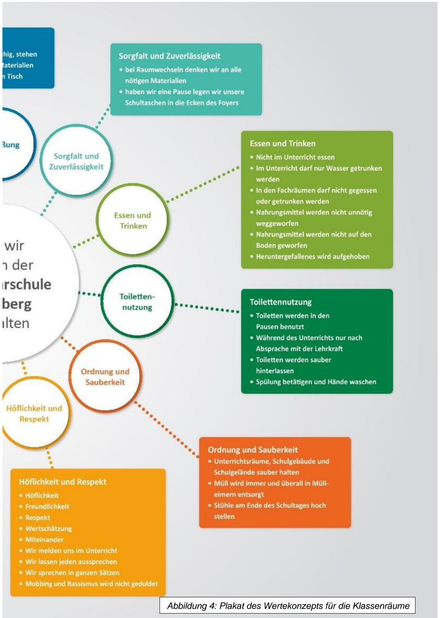
Abbildung 4: Plakat des Wertekonzepts für die Klassenräume