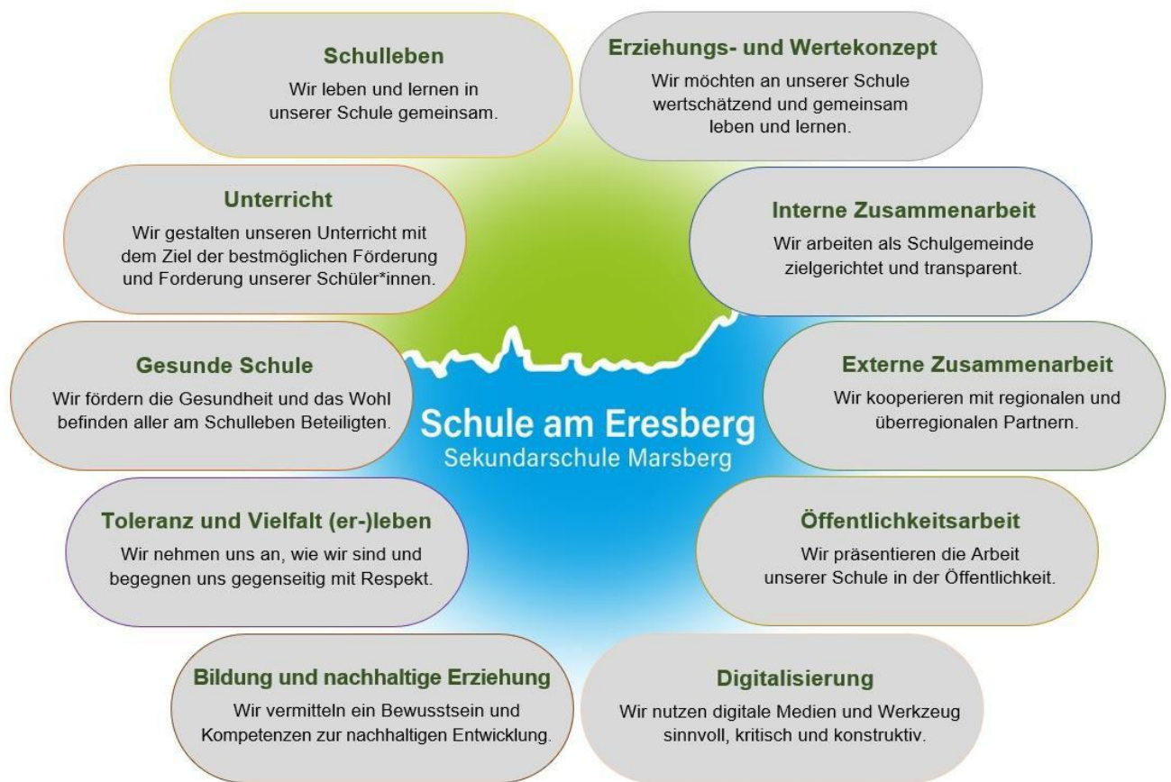
Abbildung 1: Grafik des Leitbildes